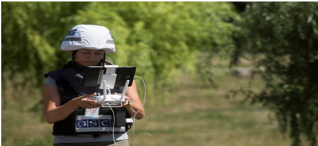
Сотрудница Миссии управляет полетом БПЛА в Донецкой области