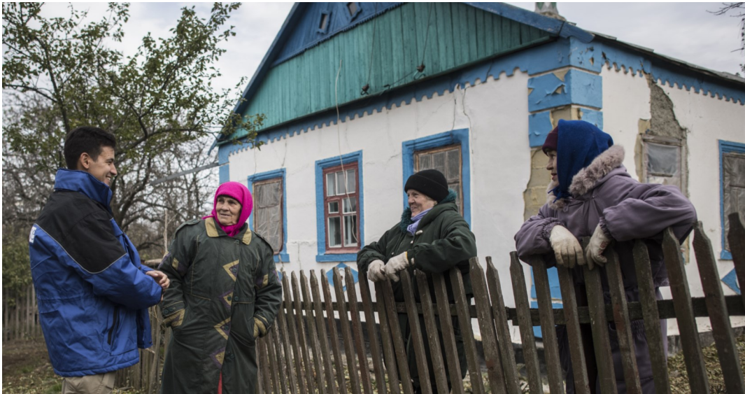
Спостерігач СММ ОБСЄ спілкується з цивільним населенням на сході України