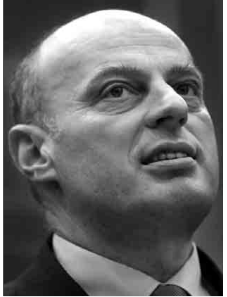
Başbakan Agim Çeku

Biz, Kosova vatandaşları ihtiyaçlarını görecek olan