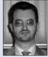
Ferid Agani Entegrasyon Grubu