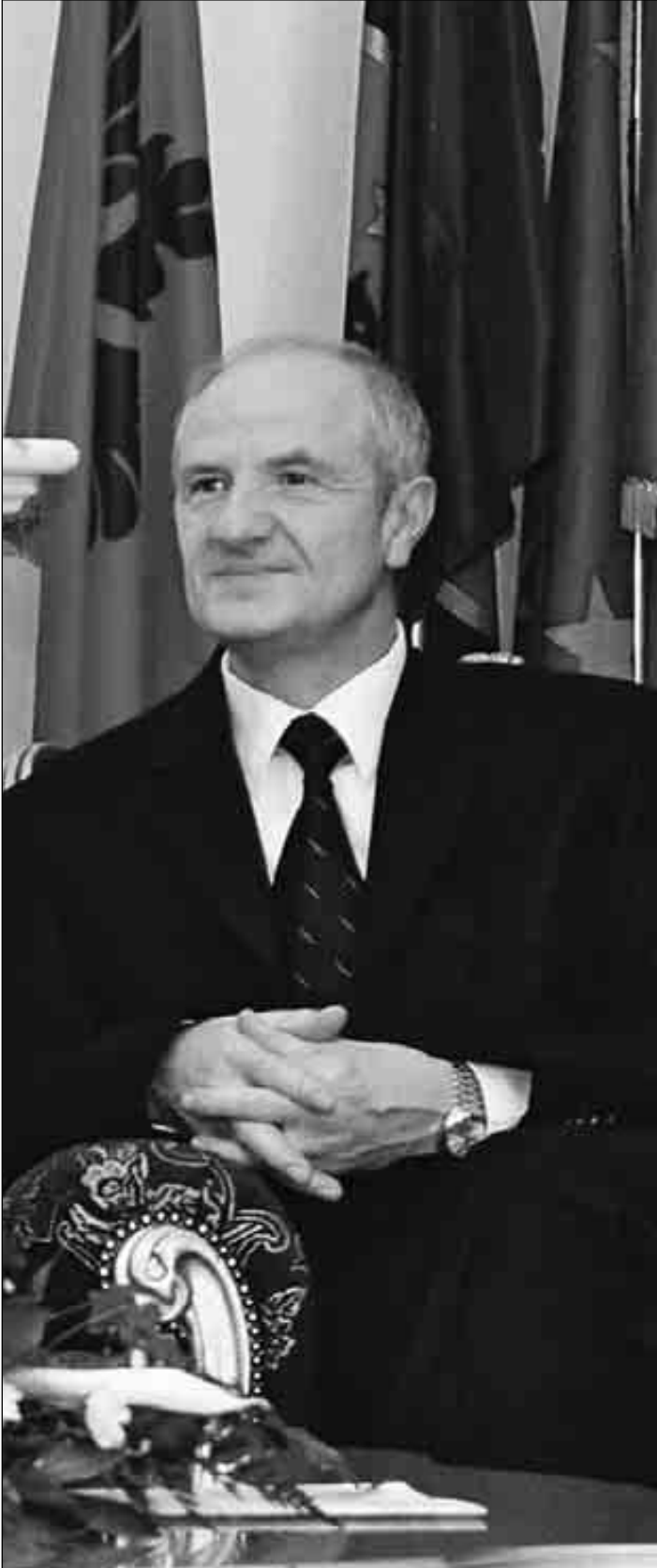
Başkan Fatmir Seydiu

BBC: Başkan Seydiu, yeni Kosova'nın veya Kosova ulusunun en başarılı insanı olarak değerlendirilen bir şahsın görevini devraldınız. Böyle büyük bir başkanın gölgesi altında, en yüksek değerlere sahip olduğu değerlendirilen bir insanın ardından bu görevi yerine getirmenin güçlükleri nelerdir?