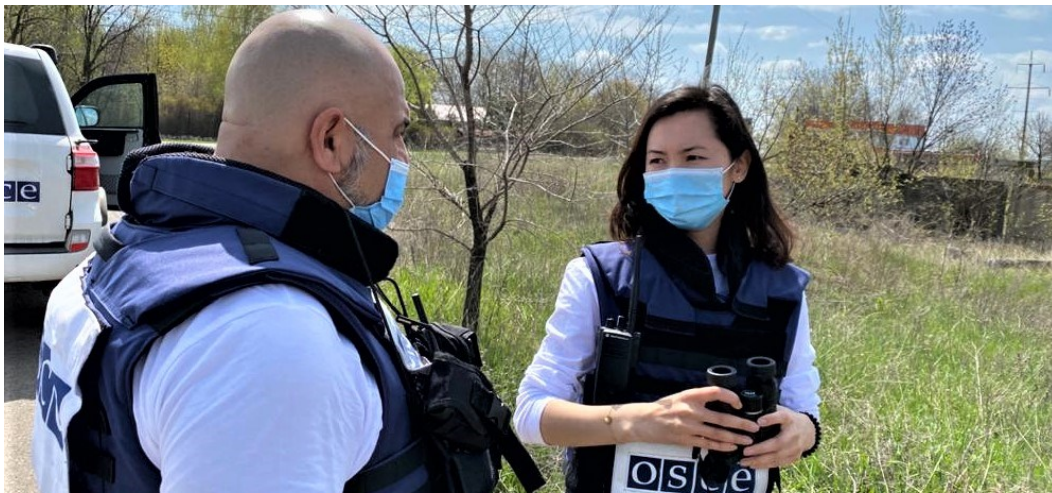
Наблюдатели СММ в Горловке Донецкой области