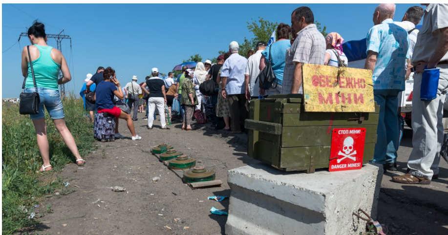
Протитанкові міни біля людей, що стоять у черзі на блокпості Збройних сил України поблизу Мар'їнки, 22 червня 2016 р.