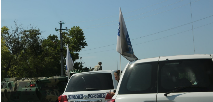
Члени так званої «ДНР» знову відмовили патрулю СММ у доступі до Новоазовська (40 км на схід від Маріуполя), 22 липня 2017 року.