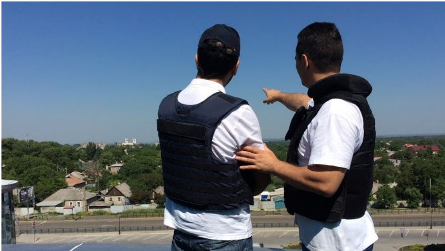
Спостерігачі СММ на спостережному пункті на залізничному вокзалі у Донецьку, червень 2015 р.