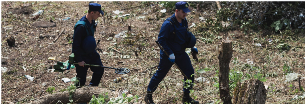
Сапери біля мосту поблизу Станиці Луганської