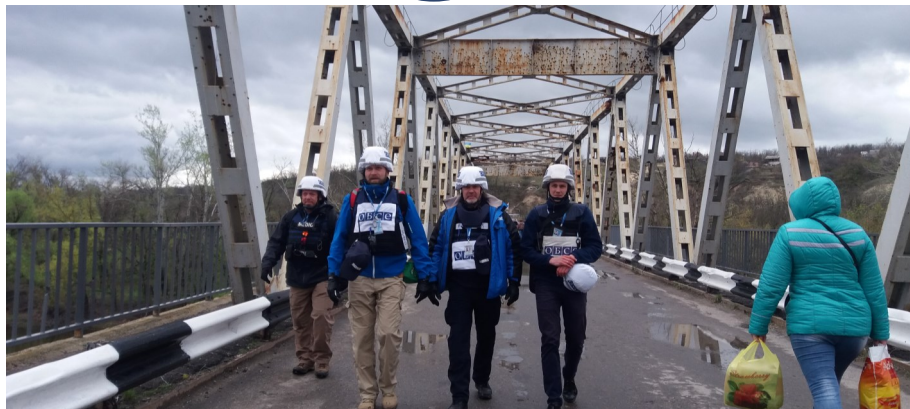
Спостерігачі СММ та мирна жителька перетинають міст через Сіверський Донець у Станиці Луганській, квітень 2017 року