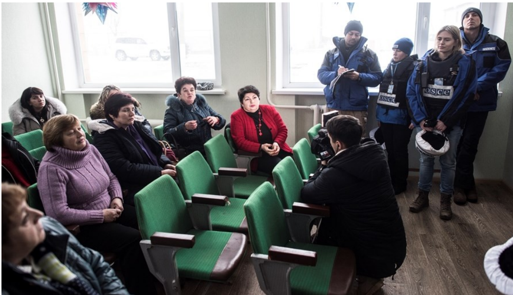
Спостерігачі СММ ОБСЄ спілкуються з сільським головою та іншими жителями Чермалика в Донецькій області.