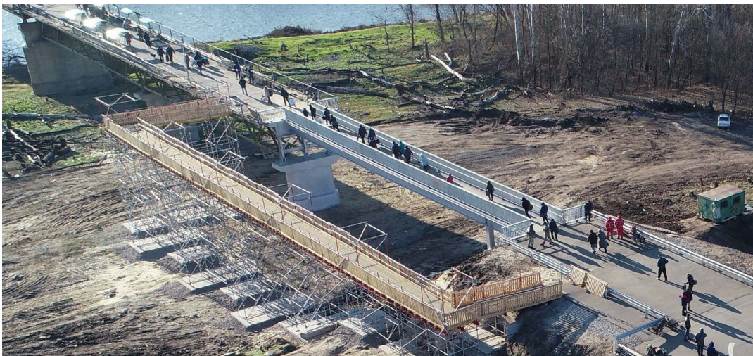
Отреставрированная секция моста у Станицы Луганской (изображение, полученное с помощью мини-БПЛА СММ)