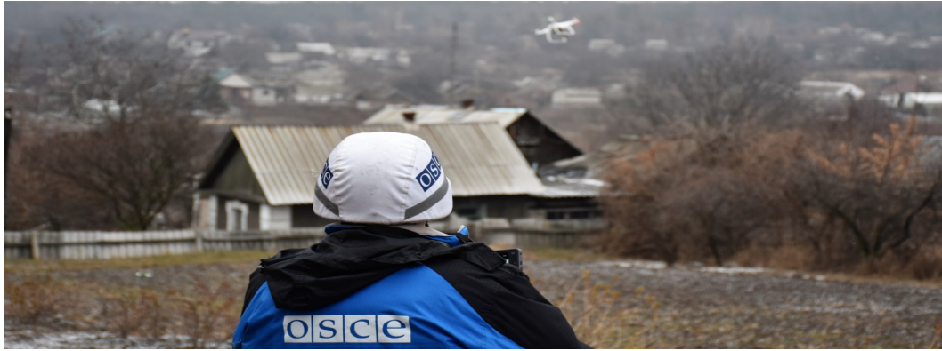
Спостерігач СММ керує БПЛА в Авдіївці, Донецька область