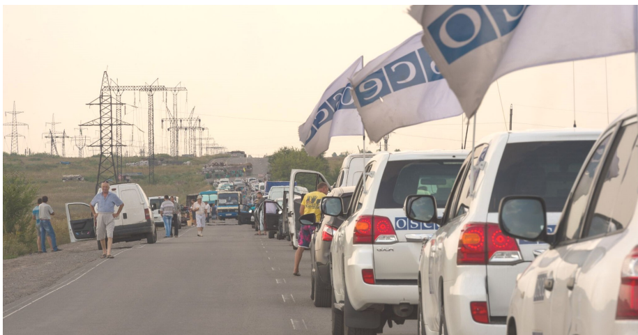
Люди в черзі на контрольному пункті в'їзду-виїзду «Мар'їнка», Донецька область, 2 серпня 2016.