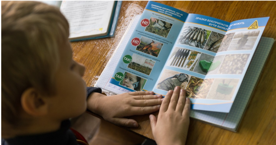
Спостерігачі СММ ОБСЄ в Донецькій області відвідали школи в Олександрівці та роздали школярам листівки з мінної безпеки, 5 жовтня 2015.