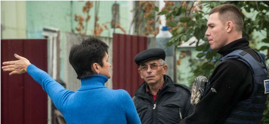
Наблюдатель СММ ОБСЕ во время патрулирования в Верхньошироковском (Фото: Евгений Малолетка/ОБСЕ).