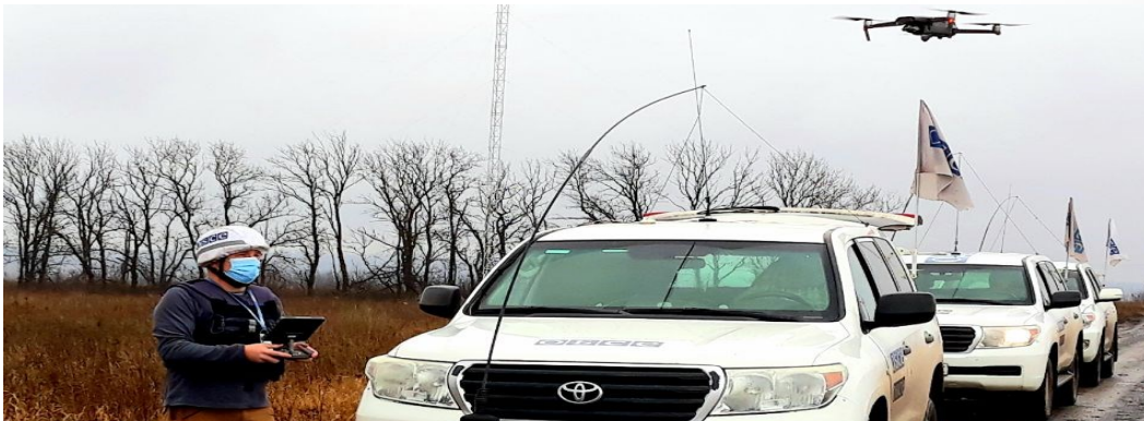
Спостерігач СММ запускає БПЛА на ділянці розведення в районі Петрівського Донецької області