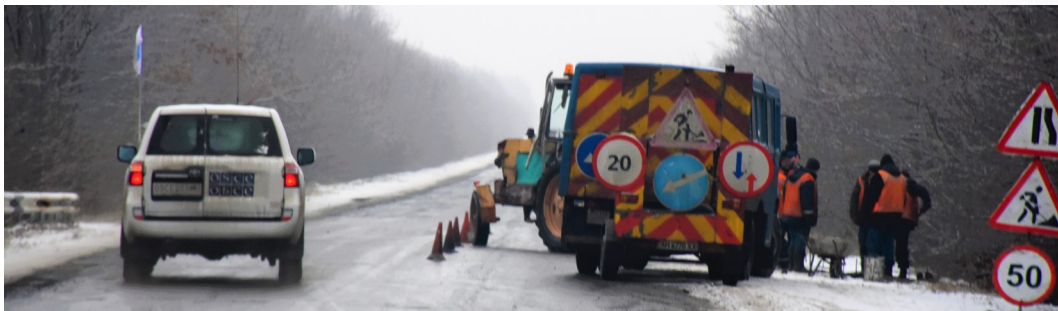
Патруль СММ на дороге в Донецкой области