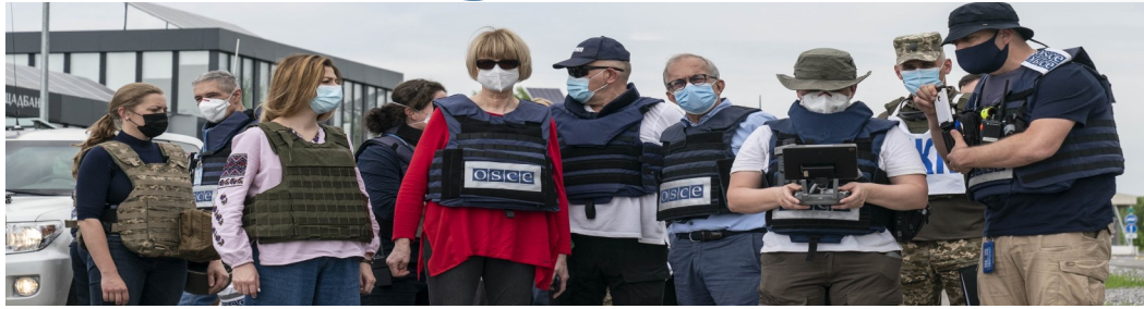
Генеральна секретарка ОБСЄ, Голова СММ та співробітники Місії на контрольному пункті в'їзду-виїзду «Новотроїцьке» в Донецькій області