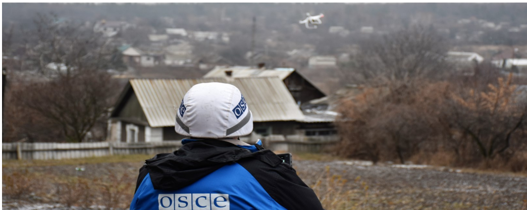
Наблюдатель СММ управляет БПЛА в Авдеевке, Донецкая область