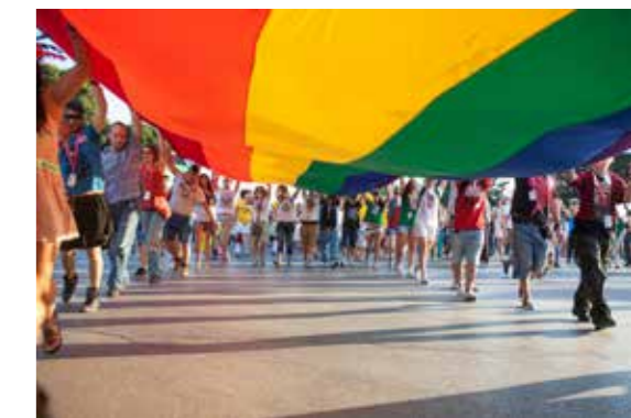
Zastava koja simbolizuje pripadnike LGBT populacije