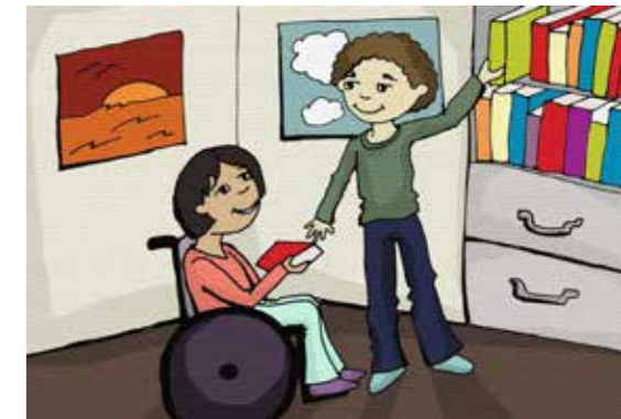
Primjer pozitivne diskriminacije tj. aktivne podrške

Međutim, ne mora svaka diskriminacija biti nužno na štetu onih koje različito tretiramo. Pozitivna diskriminacija (afirmativna akcija) tj. aktivna podrška je proces u kome se pripadnici bilo koje manjinske grupe (obično grupa koja trpi diskriminaciju) tretiraju na poseban način kako bi im se stvorili uslovi slični pripadnicima većinskih grupa. Npr. djeci iz ugroženih porodica se omogućava lakši pristup određenim institucijama; kvota za ulazak žena u parlament i sl.