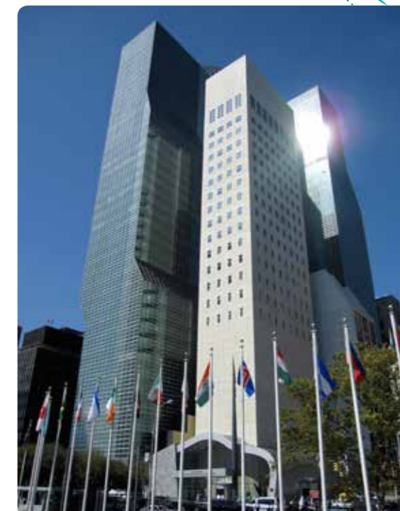
Zastave zemalja članica ispred zgrade Ujedinjenih Nacija u Njujorku

Po završetku II svjetskog rata, 1945. godine nastaju Ujedinjene nacije , međunarodna organizacija čiji je glavni cilj da brine o poštovanju ljudska prava u cijelom svijetu kroz različite međunarodne dokumente o kojima