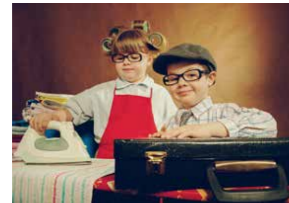
Rodne uloge oblikuje društvo

Za razliku od pola, rodne uloge su promjenljive. Na primjer, u nekim društvima žene su farmeri i obrađuju zemlju dok se u nekim drugim društvima nešto tako smatra „protivno božjoj volji“. Rodne uloge, ne samo što su različite u različitim vremenima i različitim kulturama već mogu da se menjaju u istoj kulturi i istom vremenu. U vremenima ratova i kriza, žene, ostajući bez muških članova porodice postaju glava porodice. Dakle, rod nije jednom za-