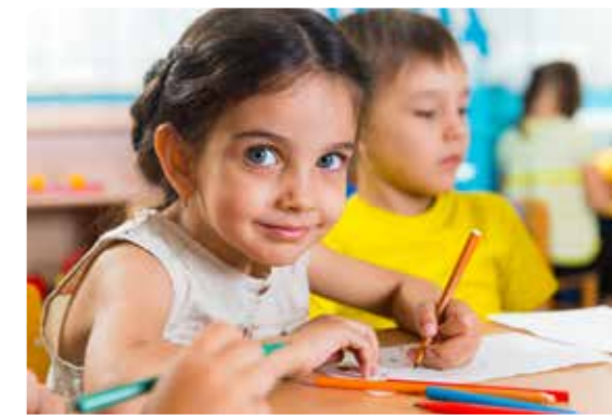
Crna Gora svojim ustavom garantuje PRAVA SVOJ DJECI

Prava djeteta nam, baš kao i ljudska prava, niko NE DAJE, mi ih IMAMO samim tim što POSTOJIMO. Međutim, veoma je važno da su prava djeteta posebno priznata u zakonima, kao i da postoji odgovarajuća zaštita u slučaju njihovog kršenja. Ako je država prihvatila i obavezala se na poštovanje međunarodnih konvencija, ona je dužna da pod prijetnjom međunarodne odgovornosti poštuje dogovorene standarde, da se uzdržava od kršenja prava i da stvori uslove za njihovo uživanje. U državama, prava djeteta su zaštićena zakonima i drugim pravnim aktima, a ostvaruju se u porodici, školi, državnim ustanovama, na radnim mjestima, na ulici i drugim mjestima i situacijama.