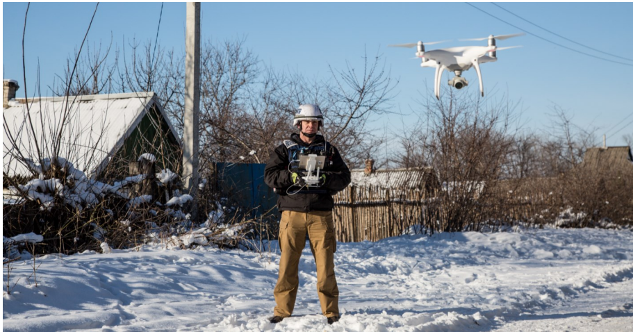
Спостерігач ОБСЄ керує польотом міні-БПЛА СММ у селищі Доломітне (Донецької області), 23 січня 2017 р.