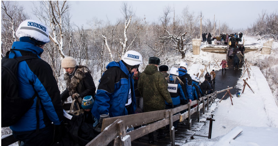
Спостерігачі ОБСЄ перетинають лінію зіткнення в районі Станиці Луганської — єдиний офіційний КПВВ у Луганській області, 16 грудня 2016 року.