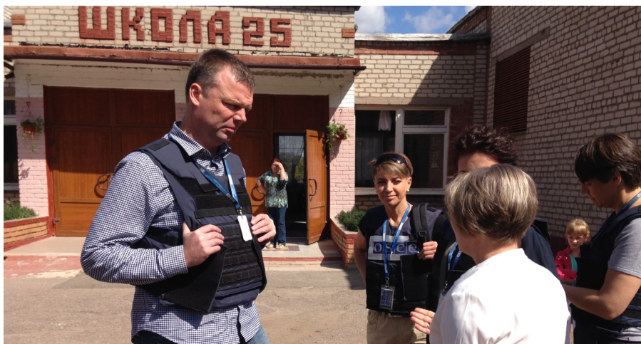
Заступник Голови СММ відвідав школу №25 у Горлівці, 21 серпня 2015 р.