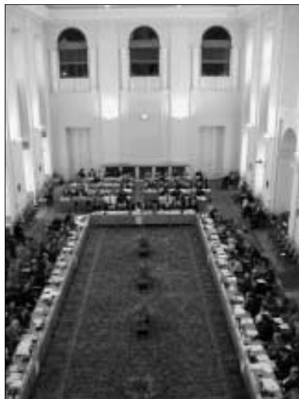
Общий вид зала пленарных заседаний Экономического форума в Чернинском дворце (Прага)

В своем заключительном слове Д. Даяну указал на важность обеспечения последовательности в рабо-