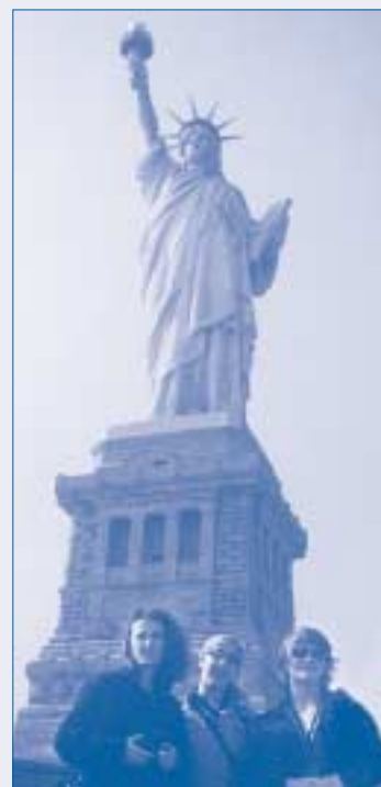
Эти студентки воспользовались возможностью, чтобы посетить Америку и принять участие в конкурсе мастерства юридической полемики