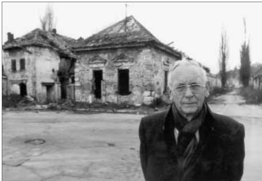
Макс ван дер Стул, завершающий свою работу на посту Верховного комиссара ОБСЕ по делам национальных меньшинств

В.д.С.: На это трудно дать точный ответ, и, честно говоря, это огорчает.