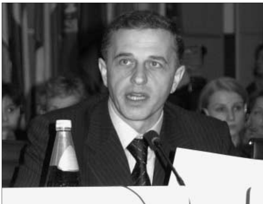
Действующий председатель ОБСЕ, министр иностранных дел Румынии Мирча Геоана

Как подчеркнул министр, должны стать нормой региональные «права собственности» на такие инициативы и руководство ими. Совещания министров обороны стран Юго-Восточной Европы, Процесс сотрудничества в Юго-Восточной Европе, Пакт о стабильности, а также созданный в Бухаресте в