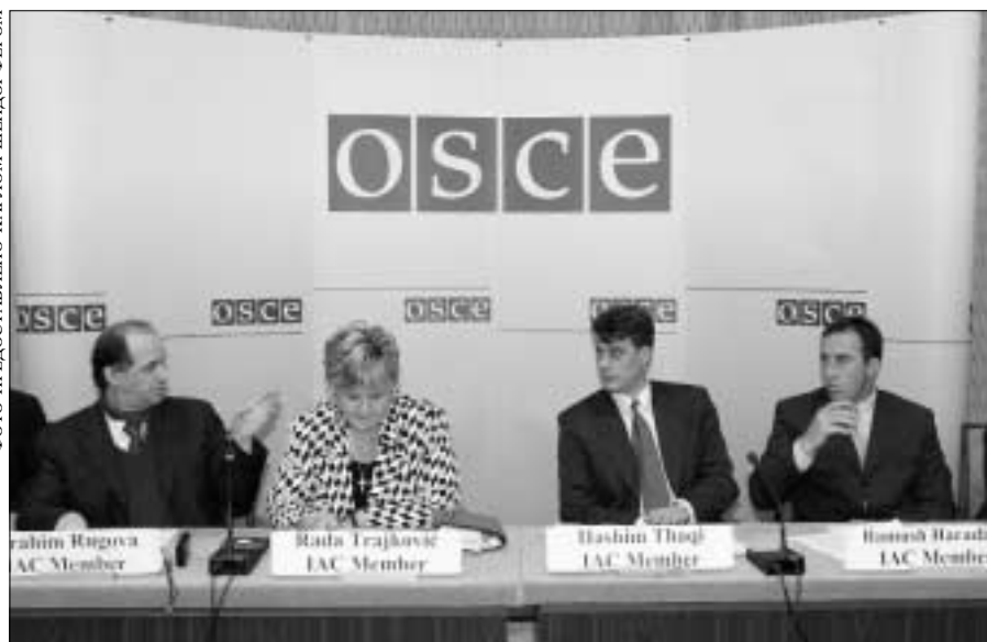
Четыре косовара – члена временного административного совета края, выступившие на заседании Постоянного совета 31 мая, позднее провели в Хофбурге пресс-конференцию