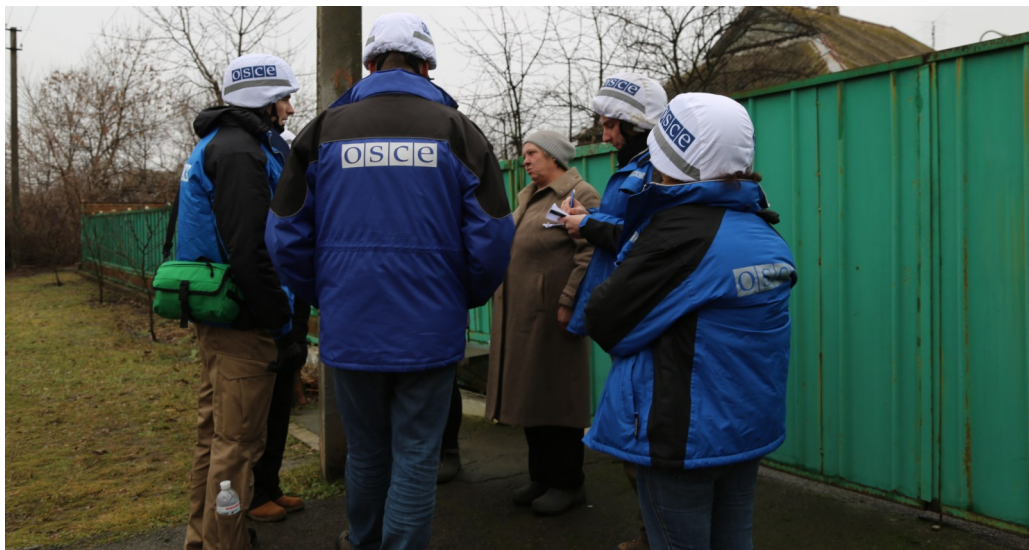
СММ ОБСЄ під час патрулювання у Травневому, 15 грудня 2017 року.