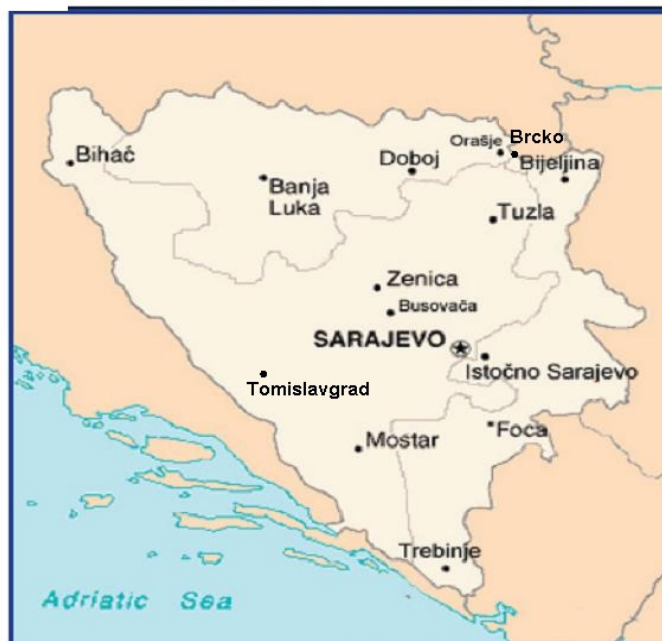
Slika 10: Pregled rasporeda zatvora u BiH