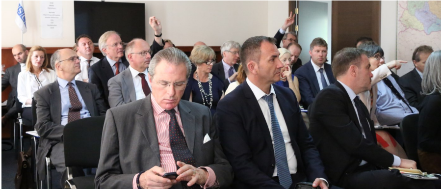
СММ принимает 27 послов ОБСЕ в Киеве, 29 мая 2017 г.