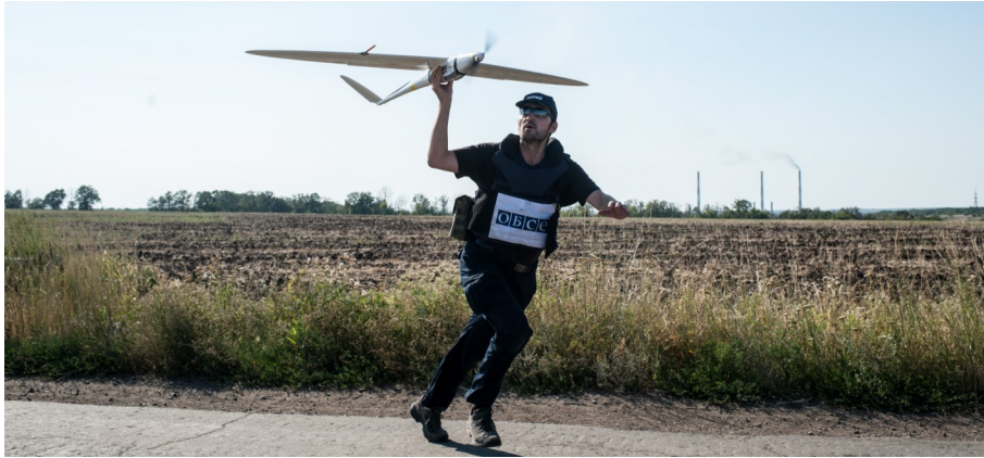
Спостерігач СММ ОБСЄ запускає БПЛА середнього радіуса дії неподалік Щастя (Луганська область).