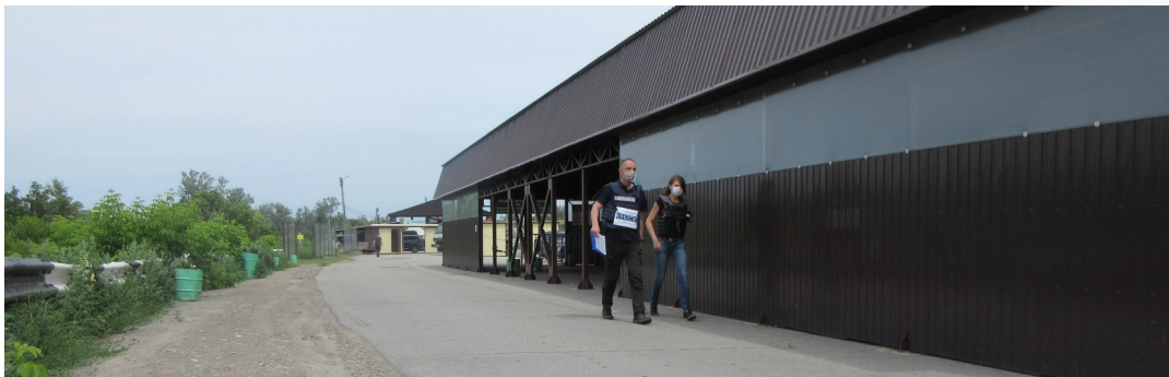
Наблюдатели СММ у моста возле Станицы Луганской