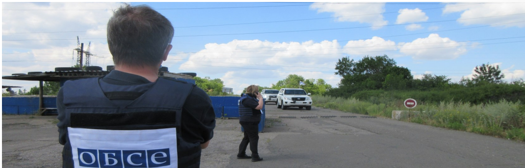
Наблюдатели вблизи участка разведения в районе Золотого Луганской области