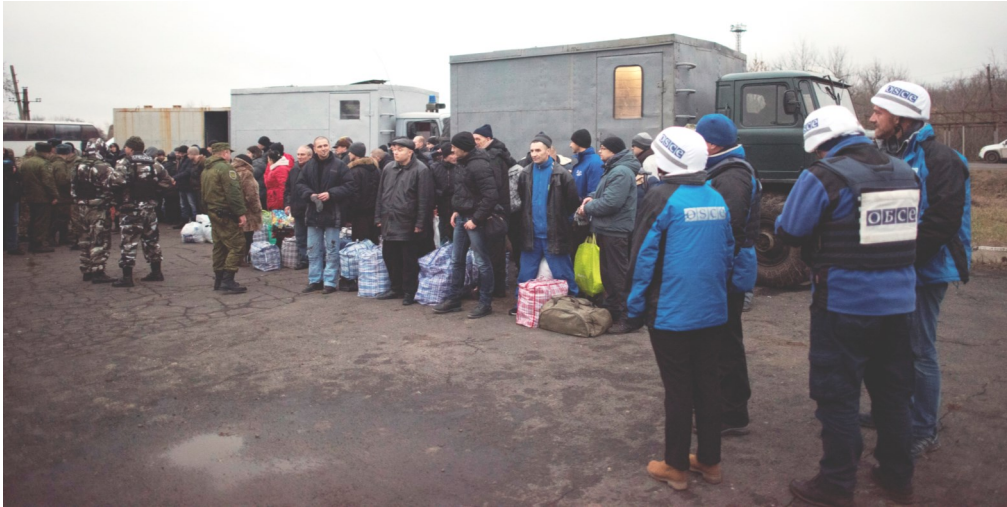
Наблюдатели СММ ОБСЕ во время обмена удерживаемыми лицами, 27 декабря 2017 года.