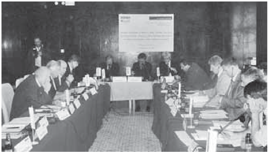
Konferenca mbi zhvillimin ekonomik e mbajtur 8 qershor

Pas fjalimit hyrës nga z. Rainer Villert, Koordinator i FNSt-së për Evropën Juglindore, u zhvillua një shkëmbim shumë i gjallë dhe kontradiktor i mendimeve. Pjesëmarrësit ranë dakord se situata makroekonomike në Kosovë është në nivel të kënaqshëm. Kështu, për buxheti u tha se është i qëndrueshëm, duke marrë parasysh se buxheti i vitit 2003 ishte 43 milionë € më i madh krahasuar me atë të vitit paraprak. Shkalla e ulët e inflacionit prej rreth 1% nuk e rrezikon zhvillimin ekonomik, derisa deficit i tregtisë së jashtme u vlerësua si problem serioz. Eksporti mbulon vetëm 4% të importit dhe dallimi i mbetur duhet të financohet nga transferi i kapitalit nga jashtë përmes organizatave ndërkombëtare dhe nga diaspora, gjë që e bënë Kosovën shumë të paqëndrueshme dhe të varur nga këto mjete të jashtme financiare.