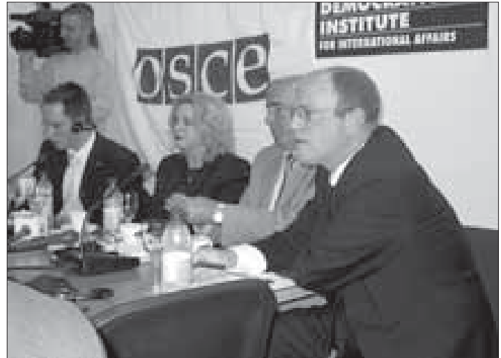
Konferencë shtypi mbi publikimin e Doracakut për dëgjime publike më 26 maj

5. Problem akoma i madh mbetet mungesa e kuadrit ligjor të trajnuar mirë, gjë që e bën të