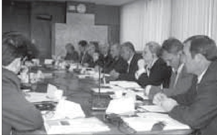
Këshilltarët politikë në seminarin e mbajtur më 3 qershor

Për të tejkaluar pjeërisht këtë situatë të pakënaqshme, Kuvendi pothuajse rregullisht ka përdorur instrumentin e seancave publike. Kështu, më