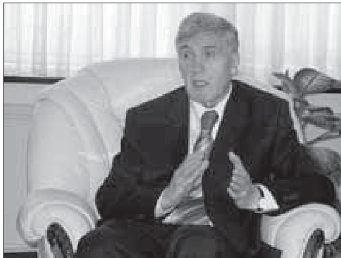
Prof. Nexhat Daci, Kryetar i Kuvendit të Kosovës

Mendoj që PSSP Holkeri u mundua mjaft. Ishte njeri i ndershëm. Në të kam parë një politikan mjaft serioz por UNMIK-u është i strukturuar në atë mënyrë që nuk mund të ketë sukses. Gjithmonë përpiqem të jem i ndershëm dhe i sinqertë. Nuk mendoj që situata do të përmirësohet. Kam pasur