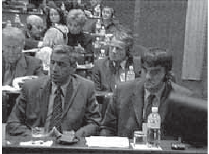
Anëtarët e Kuvendit nga Koalicioni "Kthimi" në një seancë plenare në shtator 2003

Pakënaqësia e përfaqësuesve serbë të Kosovës të IPVQ-ve arriti kulminacionin në shkurt të vitit 2004, në kohën kur duhej të inaugurohej korridori i rinovuar i Kuvendit. Në hyrje të korridorit të rindërtuar dominonin murale me momente dhe motive nga historia shqiptare. Nuk kishte asgjë që simbolizonte dhe pasqyrore historinë ose traditën e serbëve ose të tjerëve në Kosovë. Për këtë arsye KP-ja vendosi që t'i bojkotojë seancat e Kuvendit, por vazhdoi punën në nën-organet e ndryshme të Kuvendit, përfshirë komisionet dhe grupet punuese. Dhuna e marsit shpërtheu pikërisht gjatë kësaj periudhe të tensionuar politike dhe së këndejmi, KP-ja filloi bojkotimin e plotë të të gjitha institucioneve. Bashkëveprimi i brishtë në mes serbëve të Kosovës dhe IPVQ-ve u dogj dhe u shkatërrua së bashku me shtëpitë e ndezura dhe të rrënuara gjatë dhunës. Përveç kësaj, shumë serbë të Kosovës konsideronin se dhuna vetëm sa e konfirmuar dhe forcuar besimin e tyre se pjesëmarrja në institucionet e Kosovës