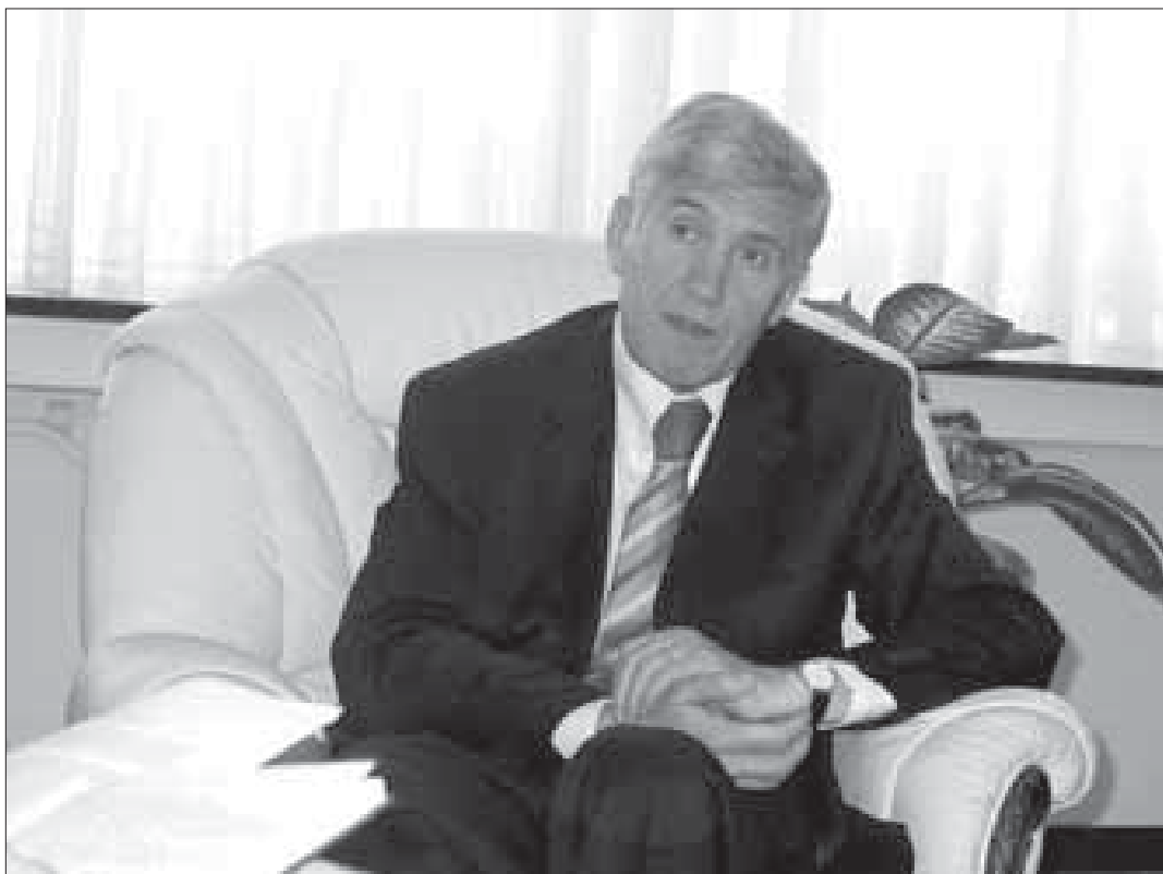
Prof. Nexhat Daci, Kryetar i Kuvendit të Kosovës

Rezultatet më të mira të Kuvendit gjatë kësaj kohe ndërlidhen me numrin e ligjeve të përpunuara. E di që në media aktivitetet tona kritikohen por kjo zakonisht vë nga persona që asnjëherë nuk kanë qenë në parlamentet tjera të Evropës dhe mbështeten në gazeta si burim i vetëm i informacionit. Në shtetet evropiane duhen tre deri pesë muaj për përpunimin e një projektligji nga ana e parlamentit. Koha më e gjatë e cila na u nevojiti për miratimin e një ligji ishte pesë javë. Në Kuvendin e tanishëm duhet të arrijmë një balancim të numrit të ligjeve të miratuara në një anë, duke pasur parasysh që Kosova nuk ka ligje, dhe cilësisë së ligjeve në anën tjetër. Një e arritur tjetër e rëndësishme e Kuvendit të tanishëm është krijimi i mjedisit të qëndrueshëm politik, e cila zgjati deri në krizën e marsit. Parlamentit është zakonisht një vend ku ndodhin diskutime të gjalla dhe ku shpesh ngritet temperatura. Duke pasur parasysh që në Parlamentin tonë ekzistojnë shtatë grupe të partive të pakicave, kam punuar në krijimin e një atmosfere të këndshme për debate. Ndihej krenar që shpesh i'a kam arritur ti zbus tensionet në mes të deputetëve