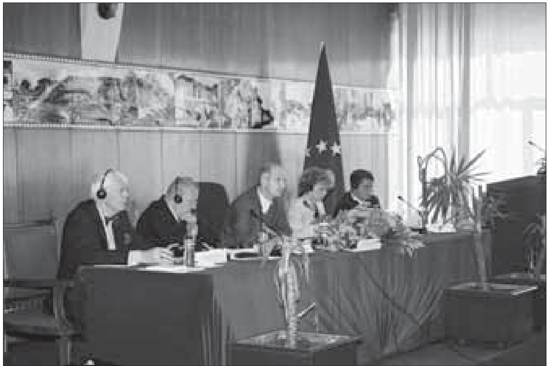
Forum i AER i mbajtur më 24 qershor 2004

jtën kohë. Ata duhet t'i ndërprejnë shprehitë e mëparshme, të fituara gjatë komunizmit si edhe gjatë regjimit të Millosheviqit dhe ata duhet ta përgatisin terrenin për një Kosovë pluraliste dhe demokratike në të ardhmen.