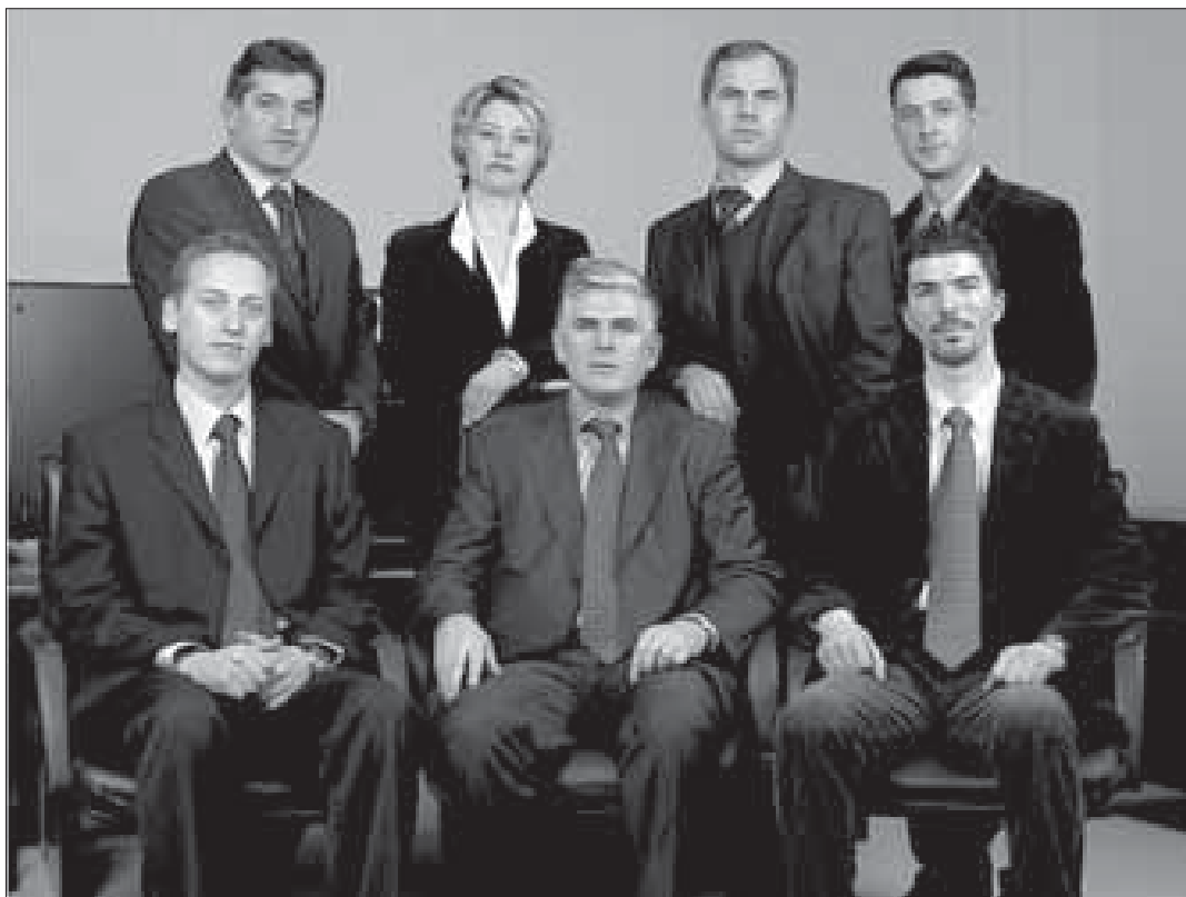
Kryeministri i Kosovës Bajram Rexhepi dhe këshillëtarët e tij

Padyshim që të gjitha institucionet janë në përmirësim e sipër. Kontaktet personale i vlerësoj si shembullore dhe funksionojnë mirë. S'do mend se është dashur kohë dhe përpjekje për krijimin e kana-