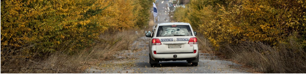
Патруль СММ на дорозі в Луганській області