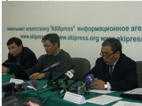
(Пресс конференция о ходе реализации проекта мониторинга СМИ в период парламентских выборов в КР)

Центр ОБСЕ в Бишкеке и Правительство Голландии предоставили поддержку НПО Интерньюс и Симера в Кыргызстане, в проведении мониторинга СМИ в период освещения парламентских выборов в Кыргызстане. Проект включает мониторинг основных электронных и печатных СМИ и помогает проанализировать насколько честный и сбалансированный подход применяют СМИ в отношении разных партий и кандидатов.