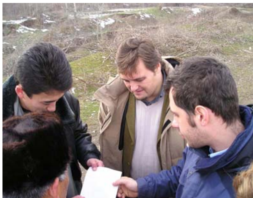
(ОБСЕ, АСТЕД и местная госадминистрация Бургонду обсуждают использование водных ресурсов в связи с трениями, возникшими между Кыргызскими и Узбекскими деревнями и возможные их решения)

12 января 2005г. Местное Бюро ОБСЕ в г.Ош в качестве организатора провело круглый стол для обсуждения возможности создания Южной Ассоциации Судов Аксакалов. Члены Судов Аксакалов, местные судьи, представители госорганов и НПО участвовали в работе этого круглого стола. В результате проделанной работы был разработан устав Ассоциации Судов Аксакалов, а участники избрали Наблюдательный Совет. Кроме того, участники этого круглого стола подготовили письмо в Правительство Кыргызстана с просьбой о поддержке Судов Аксакалов. Они также обсуждали вопрос создания справочника для Аксакалов, в котором будут собраны последние положения законодательства по ключевым вопросам, которые входят в компетенцию этого традиционного института судопроизводства. И созвучно данной инициативе, 2 февраля 2005г президент Кыргызстана, обращаясь к участникам Курултая, упомянул в своей речи о том, что важно обсудить возможности создания одного института на региональном уровне – Южной Ассоциации Судов Аксакалов «...создавая Суды Аксакалов на региональных и областных уровнях мы попытаемся создать Ассоциацию судов Аксакалов на уровне всей страны. Поэтому сегодня вам необходимо обсудить идеи и решить будущие задачи, создав организационный комитет», - сказал Президент Акаев.