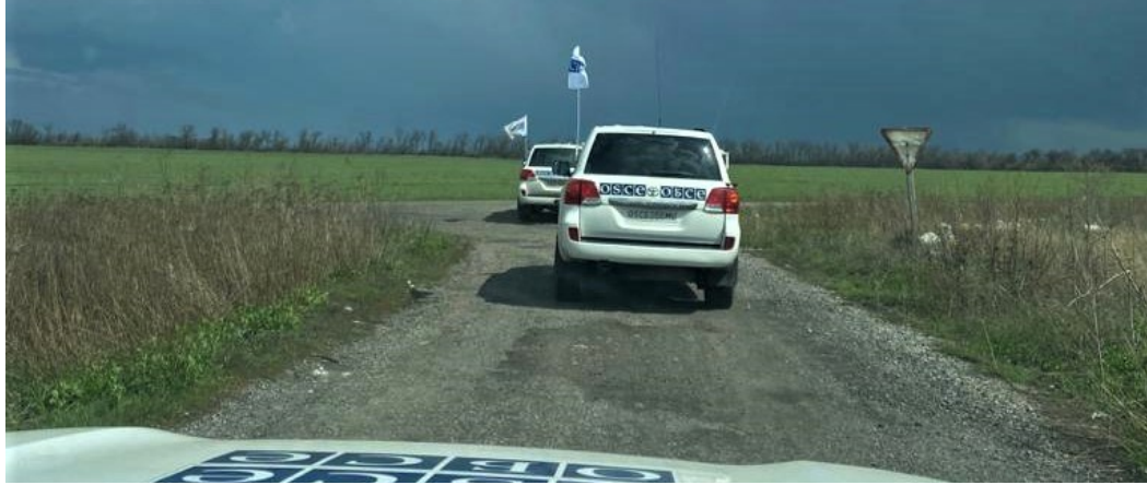
Патруль СММ у Донецькій області