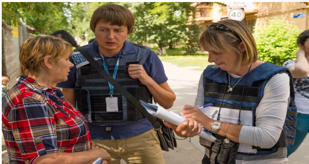
Спостерігачі СММ під час патрулювання в Донецькій області