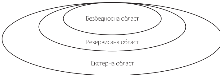
Слика 3: Области контроле италијанске полиције приликом одржавања фудбалских утакмица

Безбедносна област представља простор на самом стадиону, односно на уласку у стадион, у коме се врши детаљна контрола уласка навијача на стадион. Ту се врши детаљан преглед навијача и забрањује се унос недозвољених предмета и супстанци, као и приступ навијачима, који су поседовали те предмете. У овој области контрола навијача је најдетаљнија.