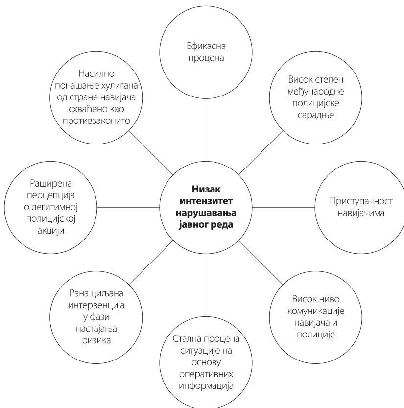
Слика број 2: Полицијске мере које доприносе смањењу насиља на спортским приредбама

Као што се могло приметити, наведено је осам фактора који доприносе ниском интензитету нарушавања јавног реда, међу којима је и висок степен међународне полицијске сарадње. Сви наведени фактори не могу се сврстати у исту групу, али такође се не може направити потпуна градација од најважнијих, ка онима који су мање битни. Може се само само констатовати, да је степен међународне полицијске сарадње један од битнијих фактора који доприноси да до насиља не дође 5 . Због тога ће у овом делу текста бити посебно размотрена међународна полицијска сарадња, а остале полицијске мере, које доприносе смањењу насиља, биће размотрене и приказане опширније у делу где