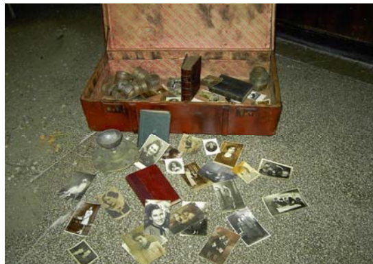
Deze koffer, een onderdeel van een project voor een holocaustherdenkingsdag, werd gemaakt door leerlingen Van de Remember Club, Vlaicu Voda International College, Roemenië, oktober 2004