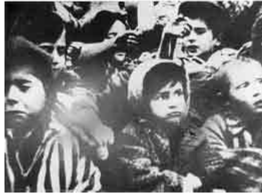
Kinderen in het kamp die hun handen in de lucht gooien bij de bevrijding, Auschwitz, Polen.