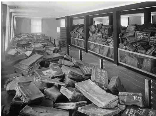
Auschwitz, Poland, na de oorlog. Koffers in het museum, Yad Vashem

In Noorwegen stimuleert de Directie Secundaire en Basisscholen alle scholen om een holocaustherdenkingsdag te organiseren. Ze stelt ook opvoedkundige informatie ter beschikking op haar website. Vele scholen organiseren poëziesessies en tentoonstellingen, terwijl andere fakkeltochten houden en overlevenden en getuigen van de holocaust uitnodigen om hun verhaal te komen vertellen.