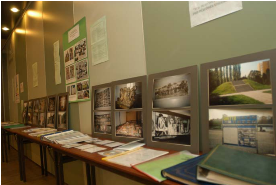
Tentoonstelling van leerlingenprojecten op de conferentie "Het levende verhaal van de Litouwse Joden" op de nationale holocaustherdenkingsdag in Litouwen, 23 september 2004.

Een school in Warschau organiseerde een uitgebreid holocaustherdenkingsproject dat het hele schooljaar liep en een hoogtepunt bereikte op de holocaustherdenkingsplechtigheid op 19 april, de dag van de opstand in het getto van Warschau. Ter voorbereiding van een tentoonstelling over het getto van Warschau selecteerden en creëerden leerlingen materialen die in verband staan met de herdenkingsites in de buurt van hun school, zoals de monumenten van het getto van Warschau en de Umschlagplatz (van waaruit Joden werden gedeporteerd naar uitroeiingskampen). Ze maakten ook een etalagekast over alle synagoges die ooit in Warschau bestonden.