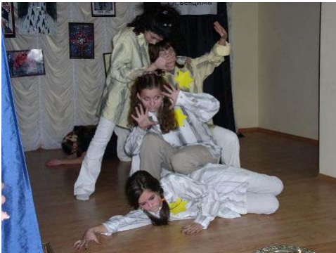
Optreden van de dansgroep Zaporozhye JCC als onderdeel van het Marathon of Memory Project, Oekraïne 2005, Tkuma (Centraal-Oekraïense Holocauststichting)

Op 27 januari heeft de Centraal-Oekraïense Holocauststichting “Tkuma” het project “Marathon of Memory” georganiseerd om de bewustwording in tientallen Oekraïense steden en gemeenten te vergroten. De evenementen omvatten onder andere een bekroningsceremonie voor leerlingen die hadden deelgenomen aan een wedstrijd over de Holocaust: “Marches of the Living” naar authentieke plekken die te maken hebben met de Holocaust; panelgesprekken met leerlingen en bekende figuren en een persconferentie met vertegenwoordigers van internationale en lokale media, in combinatie met de herdenking van de zestigste verjaardag van de bevrijding van Auschwitz-Birkenau. In Odessa bestond de herdenking uit een combinatie van literaire en artistieke beelden en verhalen van Elie Wiesel, overlevende van de holocaust en Nobelprijswinnaar. Deze evenementen werden in het hele land bijgewoond door vertegenwoordigers van de lokale en nationale politiek.