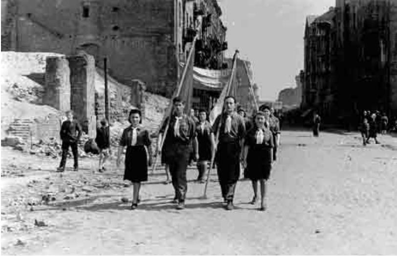
(Foto) Warschau, Polen, Naoorlogse mars voor de slachtoffers van de holocaust

In oktober 2002 keurden de ministers van Onderwijs uit de lidstaten van de Raad van Europa een resolutie goed die in alle scholen een herdenkingsdag voor de holocaust 1 invoerde. Tijdens de zesde Algemene Raad van november 2005 beslisten de Verenigde Naties om 27 januari uit te roepen tot internationale herdenkingsdag ter ere van de slachtoffers van de holocaust. De VN spoorden hun leden aan om educatieve programma's te ontwikkelen die ervoor zorgen dat deze tragedie in de herinnering van de jongere generaties 2 leeft.