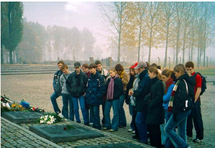
Bloemen leggen aan het herdenkingsmonument in Birkenau, 27 oktober 2004. Russische leerlingen uit Moskou namen deel aan het seminarie “Auschwitz – Geschiedenis en Symboliek” georganiseerd door het educatief centrum van het Auschwitz-Birkenau Staatsmuseum.