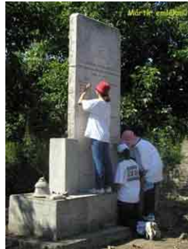
Leerlingen die een verlaten Joodse begraafplaats schoonmaken in Szob, Hongarije, 2002 (Lauder Javne Joodse Gemeenschapsschool in Budapest)