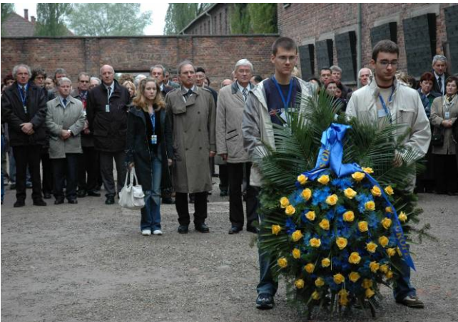
(Foto) Delegaties van jeugdorganisaties en de ministers van Onderwijs uit de 48 landen die deel uitmaken van de Europese Culturele Conventie en deelnemers aan het internationaal seminarie "Teaching Remembrance Through Cultural Heritage" leggen een bloemenkrans aan de doodsmuur op het binnenplein van Block 11 van Auschwitz I-Stammlager. Krakow en Auschwitz-Birkenau, Polen, 4-6 mei 2005. (ICEAH, Auschwitz-Birkenau State Museum)

In oktober 2002 keurden de ministers van Onderwijs uit de lidstaten van de Raad van Europa een resolutie goed die in alle scholen een herdenkingsdag voor de holocaust 1 invoerde. Tijdens de zesde Algemene Raad van november 2005 beslisten de Verenigde Naties om 27 januari uit te roepen tot internationale herdenkingsdag ter ere van de slachtoffers van de holocaust. De VN spoorden hun leden aan om educatieve programma's te ontwikkelen die ervoor zorgen dat deze tragedie in de herinnering van de jongere generaties 2 leeft.