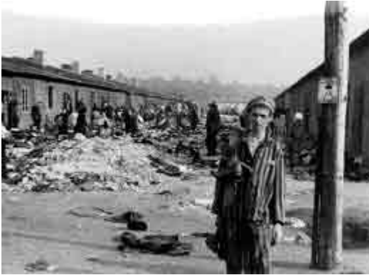
Een voormalig gevangene naast de barakken in het kamp Bergen-Belsen, Duitsland.

Leerkrachten kunnen samenkomsten organiseren met nog levende getuigen (vooral met overlevenden van de holocaust, vrijheidsstrijders en redders). Deze getuigen kunnen hun verhaal over de tweede wereldoorlog delen met de leerlingen. Live getuigenissen voor de klas zijn heel krachtig en kunnen bijdragen tot een diepgaande leerervaring bij de leerlingen. Ook het bekijken van een eerder opgenomen getuigenis kan een heel effectieve lesmethode zijn. Leerkrachten kunnen zich concentreren op wat de leerling geleerd heeft bij het zien en horen van de persoonlijke verhalen van getuigen en op wat hij met zich meedraagt na het beluisteren van de getuigenissen van de overlevenden.