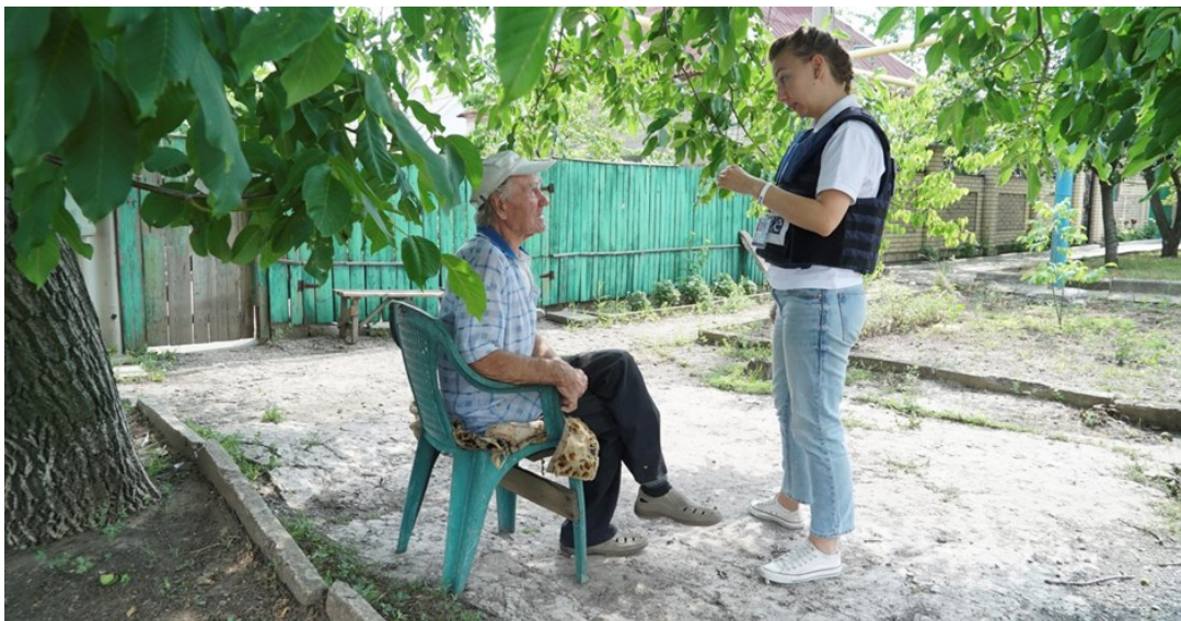
Сотрудница СММ общается с местным жителем Ясиноватой, Донецкой области.