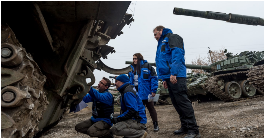
Спостерігачі СММ моніторять відведення озброєння, листопад 2015.