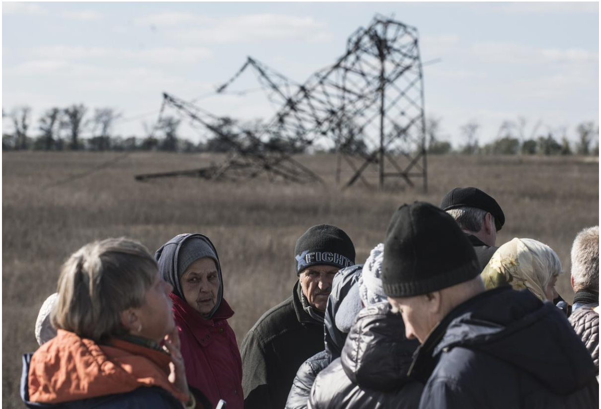
Рис. 4: Мирні жителі біля пошкоджених ліній електропередачі поблизу Мар'їнки, 2016 р.

електроенергію близько 50 000 цивільних осіб у районі Торецька.