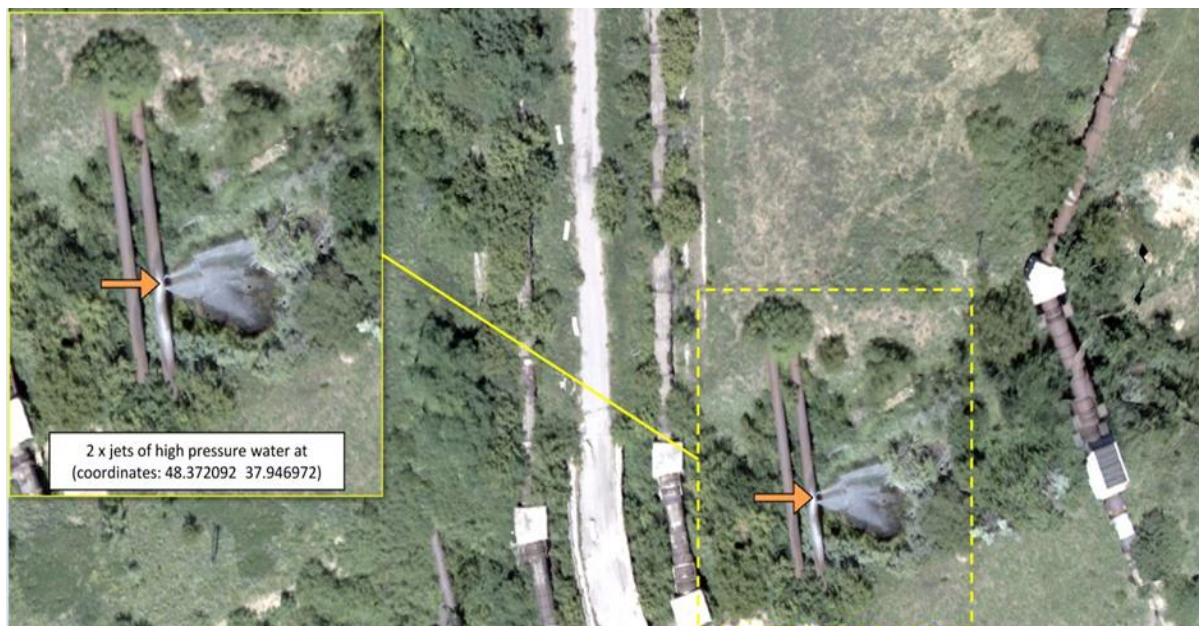
Рис. 3: Отримані за допомогою БПЛА матеріали фотофіксації витoku води на водогоні, розташованому між передовими позиціями Збройних сил України та збройних формувань у районі між підконтрольними урядові Шумами та непідконтрольній урядові Горлівкою, червень 2019 р.

Був пошкоджений під час ескалації бойових дій у районі підконтрольної урядові Авдіївки та непідконтрольної урядові Ясинуватої у кінці січня 2017 року. Однак тільки у серпні 2018 року було надано гарантії безпеки для проведення ремонтних робіт, що дозволило розпочати розмінування до проведення технічної оцінки та ремонту водогону. Протягом звітного періоду СММ сукупно, зокрема з використанням БПЛА, 24 рази сприяла організації вікон тиші і здійснювала відповідний моніторинг для уможливлення завершення ремонтних робіт, направивши для цього 120 патрулів у вересні та жовтні 2018 року.