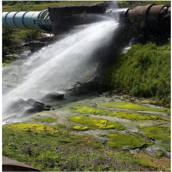
Рис. 2: Пошкоджений водогін біля Горлівки, 2015 р.

Перші зусилля СММ зі сприяння забезпеченню роботи каналу беруть свій початок у 2015 році, коли Місія вперше сприяла організації вікна тиші для уможливлення ремонтних робіт на трьох паралельних трубопроводах СДД, які були пошкоджені в результаті бойових дій. Протягом 42 днів поспіль у період із липня до серпня того ж року СММ сприяла проведенню ремонтних робіт та здійснювала відповідний моніторинг аж до їх успішного завершення. Місія використовувала отриманий досвід під час планування подальших вікон тиші уздовж лінії зіткнення.