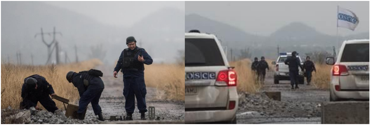
Рис. 1: Роботи з розмінування на дорозі до Красногорівської газорозподільної станції, жовтень 2017 р.

Важливо і те, що збільшення кількості вікон тиші (якщо порівнювати з попереднім звітним періодом) може також пояснюватися зростанням потреби в ремонтних роботах та технічному обслуговуванні у зв'язку з погіршенням безпекової ситуації в районі деяких ключових об'єктів інфраструктури, зокрема на згаданій насосній станції поблизу Василівки. Якщо порівнювати з попереднім звітним періодом, збільшення кількості пошкоджень таких об'єктів змусило СММ активніше залучатися до сприяння діалогу задля уможливлення проведення ремонтних робіт, технічного обслуговування та забезпечення функціонування таких об'єктів з метою недопущення значних гуманітарних наслідків через призупинення роботи ключових об'єктів інфраструктури.