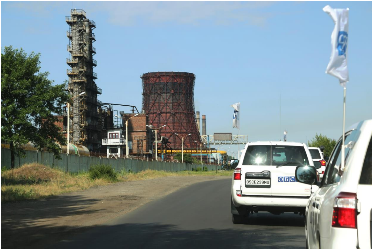
Рис. 5: Спостерігачі СММ у Макіївці, червень 2017 р.