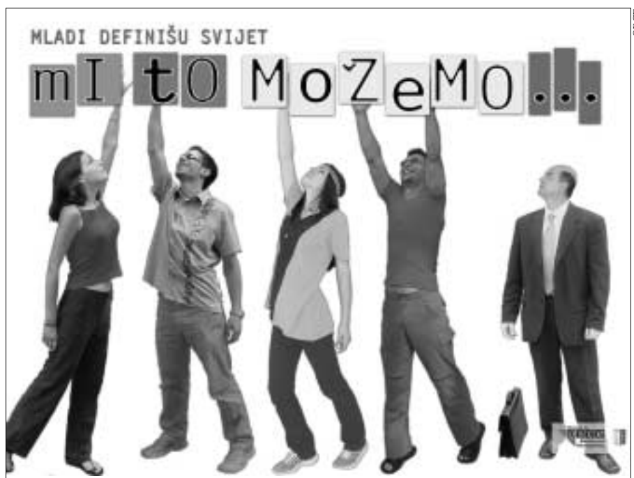
«Будущее – в руках молодых: мы это можем!»