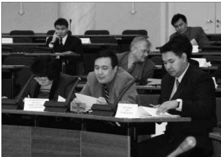
Дискуссии за «круглым столом» продолжались благодаря настойчивости и заинтересованности участников.