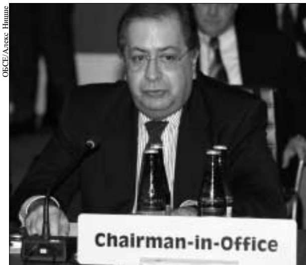
Министр иностранных дел Португалии, Действующий председатель ОБСЕ в 2002 году Жайми Гама.

Директор Бюро по демократическим институтам и правам человека Жерар Студман и Верховный комиссар по делам национальных меньшинств Рольф Экеус. Бюро Представителя ОБСЕ по вопросам свободы средств массовой информации было представлено старшим советником Юттой Вольке. От Парламентской ассамблеи ОБСЕ на встрече присутствовал ее Председатель Адриан Северин.