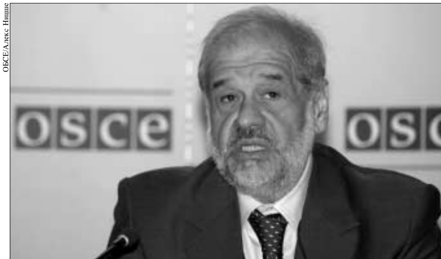
Министр иностранных дел бывшей югославской Республики Македонии Слободан Чашуле на встрече с журналистами после выступления перед членами Постоянного совета.

Ни наша добрая воля, ни наши усилия не принесут результатов до тех пор, пока мы всерьез не начнем заниматься реальными проблемами, накопившимися в регионе за десять