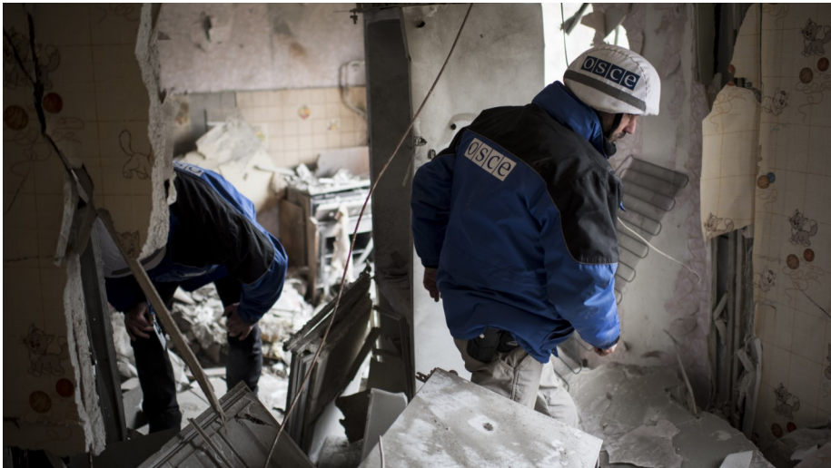
Спостерігачі СММ оцінюють пошкодження будівлі на сході України, березень 2015 р.