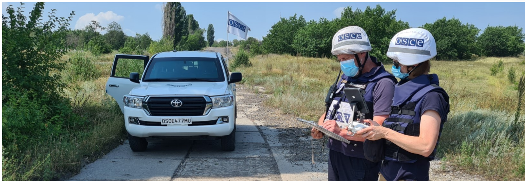
Члени патруля Місії запускають БПЛА в Луганській області