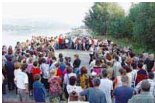
МИССИЯ ОБСЕ В БОЛДОВИЛИАНА СОРРЕНТИНО

1 сентября 2004 года: В молдавской школе в Рыбнице первый учебный день вряд ли является поводом для праздника. Родители и учителя собрались на берегу Днестра; у детей до сих пор нет школьного здания.