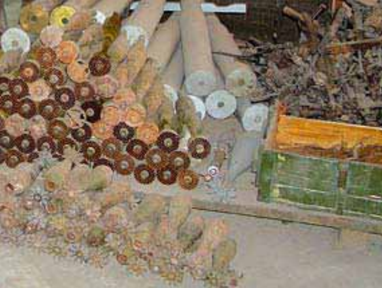
ОБСЕЦЕНТР ПО ПРЕДОТВРАЩЕНИЮ КОНФЛИКТОВ