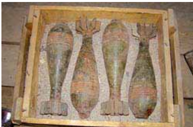
ОБСЕЦЕНТР ПО ПРЕДОТВРАЩЕНИЮ КОНФЛИКТОВ