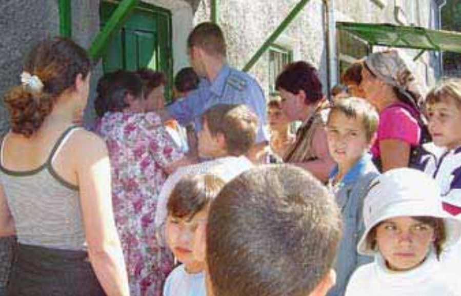
МИССИЯ ОБСЕ В БОЛДОВИЛИАНА СОРРЕНТИНО