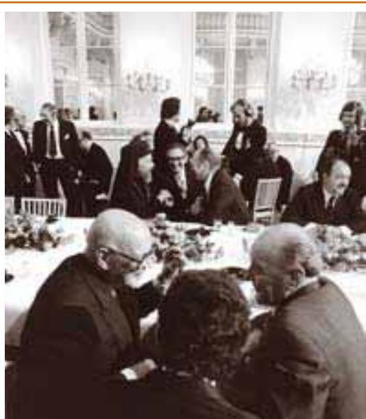
На официальном обеде в честь съехавшихся в Хельсинки делегатов президент Финляндии У. Кекконен (на переднем плане слева) беседует с первым секретарем Венгерской социалистической рабочей партии Я. Кадаром. На противоположной стороне стола свою беседу ведут президент Кипра архиепископ Макариос, госсекретарь США Г. Киссинджер и президент США Дж. Форд.

(Обратный перевод лингвистической службы ОБСЕ)