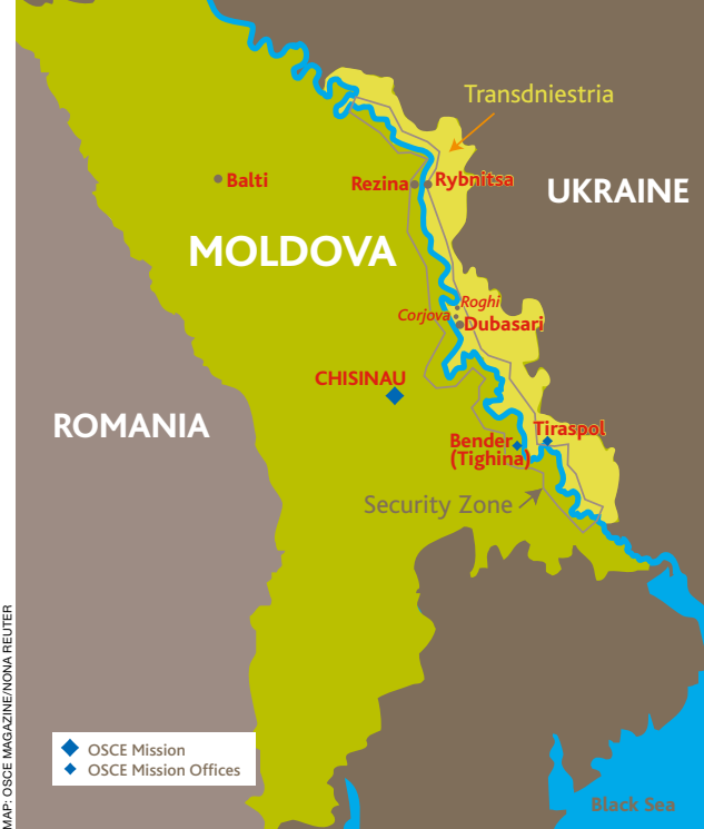
MAP: OSCE MAGAZINE/NONA REUTER

Миссия ОБСЕ в Молдове со штаб-квартирой в столице Кишиневе официально была установлена в феврале 2003 года и начала свою деятельность в апреле. Ее филиал в приднестровском административном центре в Тирасполе был открыт в феврале 1995 года, а филиал в Бендерах – в мае 2003 года.