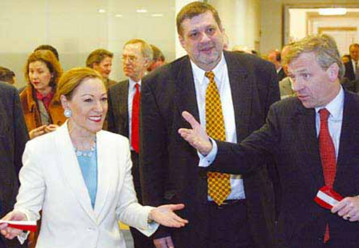
13 января 2003 года, Вена. Ян Кубиш с министром иностранных дел Австрии Бенитой Ферреро-Вальднер и министром иностранных дел Голландии Япом де Хуп Схеффером во время председательства Нидерландов в ОБСЕ.

том для предотвращения конфликтов, вывода из кризисных ситуаций и постконфликтной реабилитации, как это предполагалось вначале. И это вызывает сожаление. Нашим политическим лидерам необходимо активизировать деятельность ОБСЕ в качестве форума для проведения политического диалога на высоком уровне».