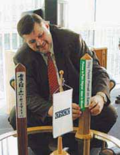
Ян Кубиш в своем бывшем офисе на Рингштрассе, Вена.

низации, сохраняя преэминентность между ежегодными председательствованиями, и не уходить от явно публичной политической роли. «Генеральный секретарь находится в уникальной и привилегированной позиции по отношению к государствам-участникам, поэтому нет никакой проблемы в том, что он играет политическую роль»