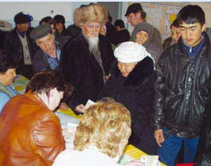
Жители Аравшана, деревни рядом с Бишкеком, готовы голосовать во втором раунде парламентских выборов.

27 февраля 2005 года: парламентские выборы. По оценке докладов 175 наблюдателей БДИПЧ из 28 стран, выборы признаны более конкурентными, чем раньше, но «к сожалению, была отмечена покупка голосов избирателей, снятие с регистрации кандидатов, вмешательство в освещение выборов средствами массовой информации и настораживающе низкое доверие к юридическим и выборным институтам со стороны как населения, так и кандидатов».