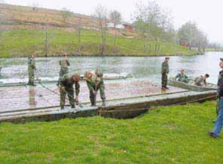
ОБСЕ/МИССИЯ В БИГ