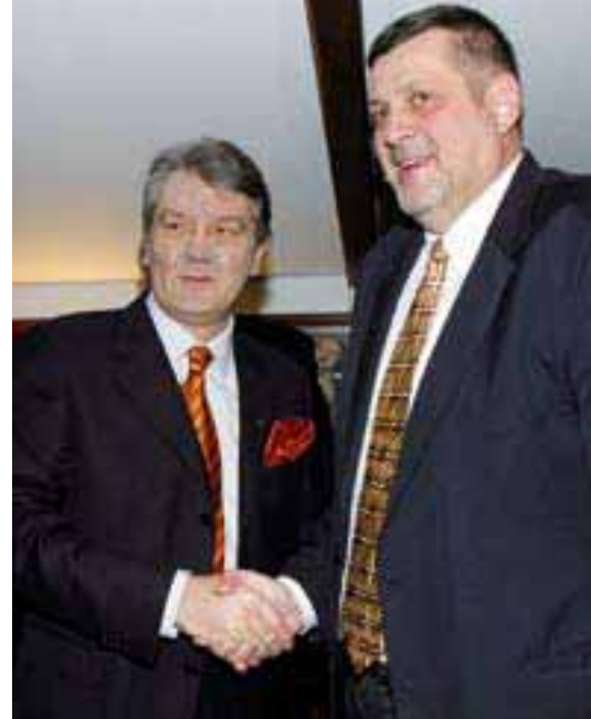
26 ноября 2004 года, Киев: оппозиционный лидер Виктор Ющенко приветствует Яна Кубиша во время международных посреднических усилий для разрешения политического кризиса в Украине.

«Мне трудно понять, как после 10–15 лет, мы все еще сталкиваемся с так называемыми «замороженными» конфликтами. Были приложены огромные усилия для их разрешения, и я с грустью констатирую, что главная цель не достигнута».