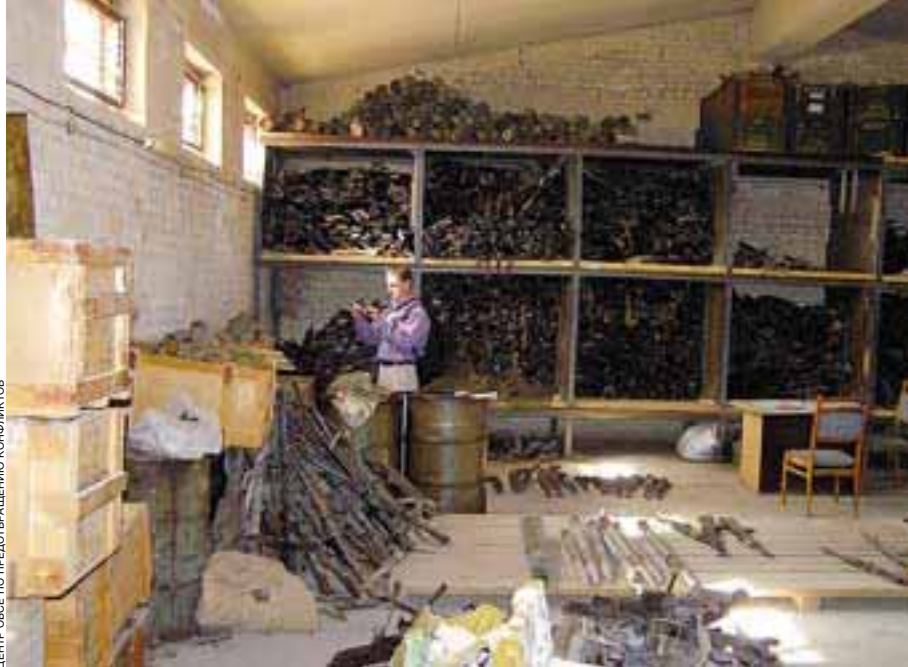
ЦЕНТР ОБСЕ ПО ПРЕДОТВРАЩЕНИЮ КОНФЛИКТОВ

Три этих страны, а также Российская Федерация и Украина запросили помощь в уничтожении излишков боеприпасов. Ужасающие картины разрушительных взрывов на юго-востоке Украины в мае 2004 года все еще свежи в нашей памяти. Серия взрывов, вызванных стихийно возникшим пожаром на большом оставшемся со времен Советского Союза складе артиллерийских снарядов, которые должны были быть списаны, продолжалась восемь дней. Пять человек погибло, сотни были ранены, а тысячи местных жителей