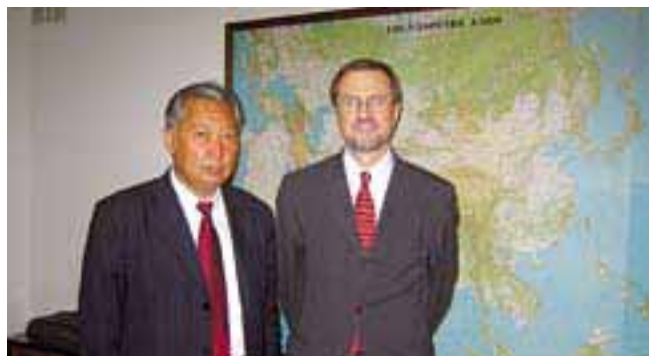
Алоис Петерле (справа) в Бишкеке с действующим президентом Кыргызстана Курманбеком Бакиевым.

Алоис Петерле, член Европейского парламента, является личным представителем Действующего председателя ОБСЕ в Центральной Азии. С 1990 по 1992 год он был премьер-министром первого демократически избранного правительства Словении. Он также бывший министр иностранных дел Словении.