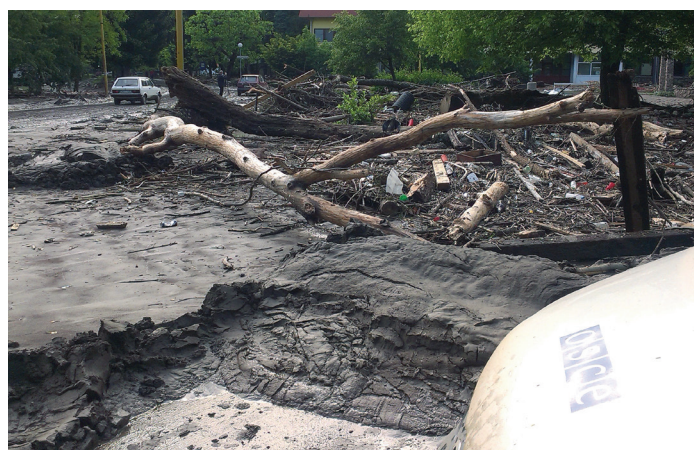
Транспортные средства ОБСЕ были направлены в пострадавшие от наводнения в мае 2014 года населенные пункты Боснии и Герцеговины с целью помочь властям оценить нанесенный ущерб

государств – участников ОБСЕ, так и других заинтересованных сторон, способствуя тем самым предупреждению конфликтов и укреплению доверия.