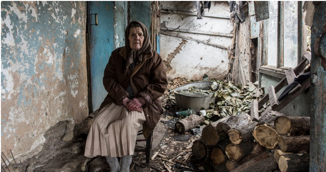
Жителька похилого віку у своїй домівці в Новоолександрівці, Луганська область