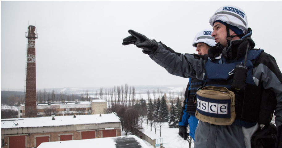
Спостерігачі ОБСЄ на спостережному пункті Спільного центру з контролю та координації, м. Ясинувата, 21 січня 2017 р.