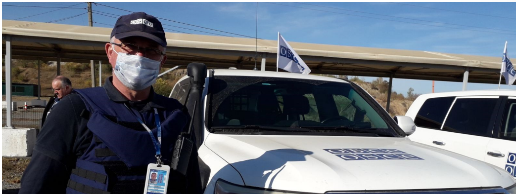
Спостерігач СММ на КПВВ «Новотроїцьке», Донецька область