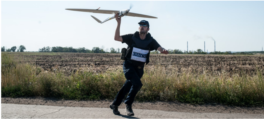
Наблюдатель СММ ОБСЕ запускает БПЛА среднего радиуса действия недалеко от Счастья (Луганская область).